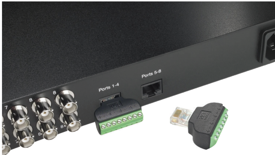
Tornillo del bloque de terminales canal pinout